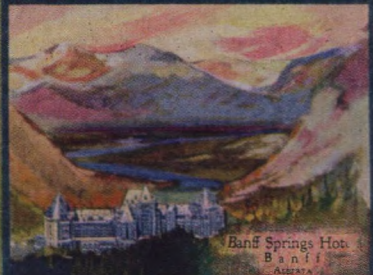
Banff Springs Hotel Banff Alberta