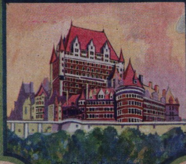
The Chateau Frontenac Quebec Quebec