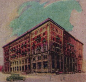
The Royal Alexandra Winnipeg Manitoba