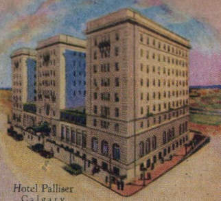
Hotel Palliser Calgary Alberta