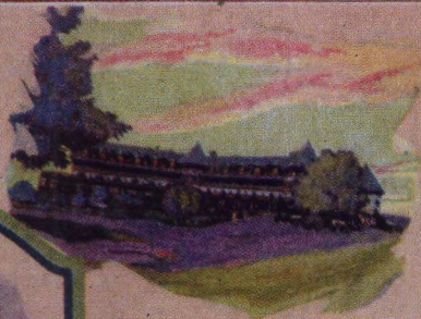
The Algonquin St. Andrews New Brunswick