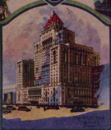
The Royal York Toronto Ontario