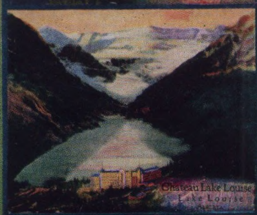
Chateau Lake Louise Lake Louise Alberta