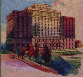
Hotel Saskatchewan Regina Saskatchewan