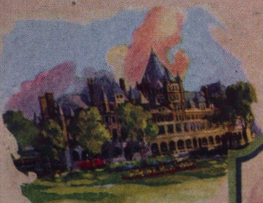
The Place Viger Montreal Quebec