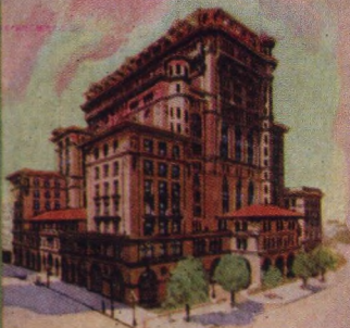
Hotel Vancouver Vancouver British Columbia