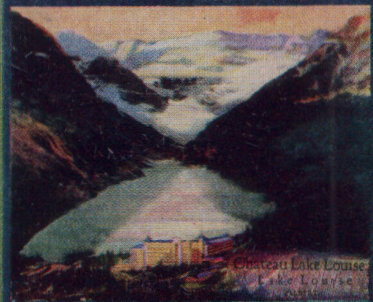
Chateau Lake Louise Lake Louise Alberta