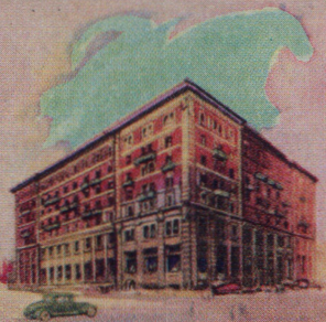
The Royal Alexandra Winnipeg Manitoba