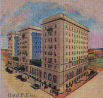
Hotel Palliser Calgary Alberta