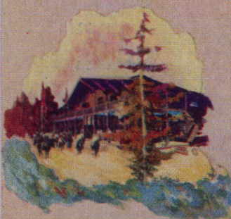
Emerald Lake Chalet Near Field British Columbia