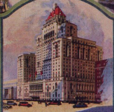
The Royal York Toronto Ontario