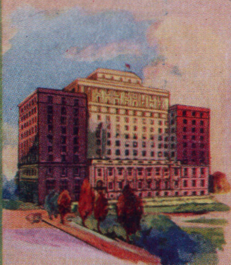
Hotel Saskatchewan Regina Saskatchewan