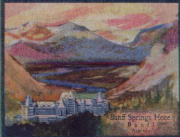
Banff Springs Hotel Banff Alberta