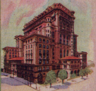
Hotel Vancouver Vancouver British Columbia