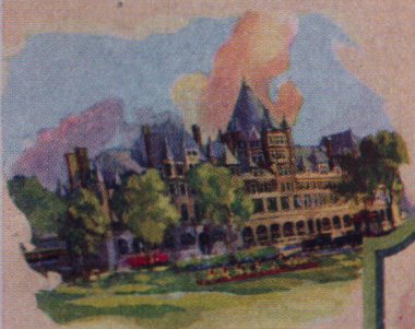
The Place Viger Montreal Quebec